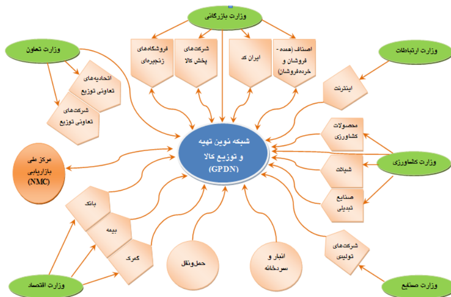
نمودار 3. مدل شبکه‌ای تهیه و توزیع کالا در ایران

تجزیه و تحلیل و بررسی پاسخ‌های ارائه‌شده توسط صاحب‌نظران و خبرگان به سؤالات پرسش‌نامه، نشان می‌دهد که 6 وزارتخانه به طور مستقیم و غیرمستقیم بر شبکه تهیه و توزیع کالا تاثیرگذار هستند. این وزارتخانه‌ها و مجموعه‌های تحت نظارت آنها شامل وزارت بازرگانی (فروشگاه‌های زنجیره‌ای، شرکت‌های پخش کالا، اصناف، عمده‌فروشان، خرده‌فروشان، ایران کد، ...)، وزارت تعاون (شرکت‌های تعاونی توزیع، اتحادیه‌های تعاونی توزیع، ...)، وزارت جهاد کشاورزی (محصولات کشاورزی، شیلات، صنایع تبدیلی، ...)، وزارت صنایع (شرکت‌های تولیدی، ...)، وزارت اقتصاد (بانک، بیمه، گمرک، ...) و وزارت ارتباطات و فناوری اطلاعات (اینترنت، ...) هستند. علاوه بر این، 2 مجموعه شامل شرکت‌های حمل و نقل کالا و سردخانه و انبارها نیز بر شبکه تهیه و توزیع کالا در کشور تاثیرگذارند. بخش عمده عوامل و متغیرهای فوق مانند شرکت‌های پخش کالا، فروشگاه‌های زنجیره‌ای، عمده‌فروشان و خرده‌فروشان، شرکت‌های حمل و نقل، سردخانه‌ها و انبارها، شرکت‌های تولیدی و صنایع تبدیلی متعلق به بخش غیردولتی شامل بخش‌های خصوصی و تعاونی هستند. برخی از این متغیرها علاوه بر شبکه توزیع بر سایر متغیرهای موجود در مدل نیز تاثیرگذارند. به همین دلیل ارتباطات متعددی به صورت یک‌طرفه و دوطرفه بین متغیرهای موجود در مدل وجود دارد. مدل شبکه‌ای تهیه و توزیع کالا در ایران بر مبنای تحلیل نتایج پاسخ‌های خبرگان به پرسشنامه‌ها در نمودار شماره 3 ارائه شده است. این مدل، بازیگران و نقش‌آفرینان اصلی شبکه تهیه و توزیع کالا در کشور و جایگاه و نقش آنها را در این شبکه نشان می‌دهد.